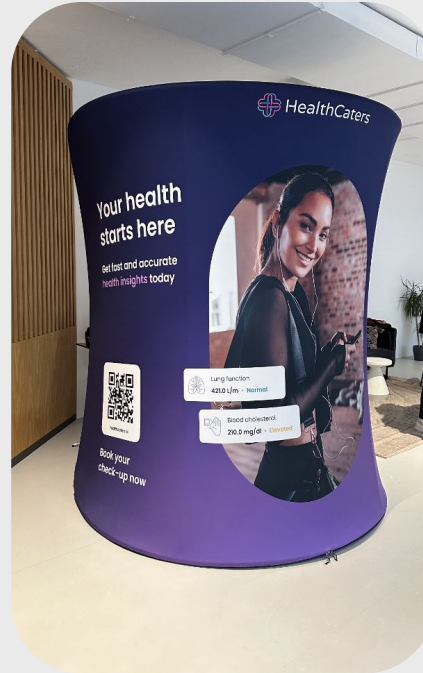
Gesundheitsstation: Blick von außen