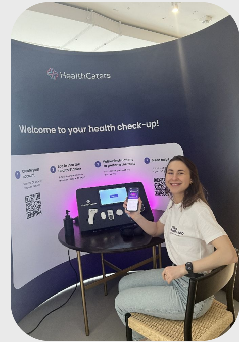
Gesundheitsstation innerhalb des Standes